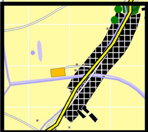
uitsnede Chiro Beukenhout