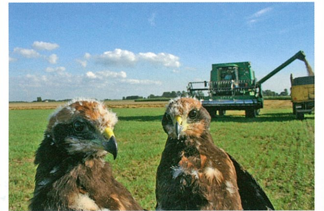
Uitgemaaide jongen aan de rand van het perceel gezet

Dit kunnen we voorkomen door het nest te beschermen. De landbouwer krijgt hiervoor een vergoeding om een stuk (100m 2 ) niet te oogsten en draagt zo dus een steentje bij tot het beschermen van onze natuur.