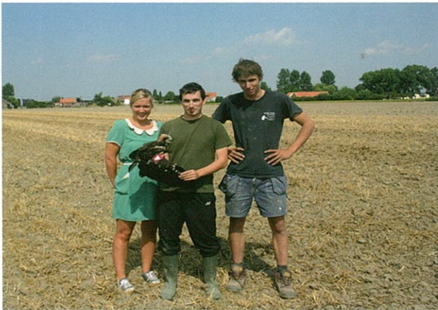
Een jong boerenkoppel verleende graag zijn medewerking!

Sinds 2011 werden er in het Meetjeslands krekengebied al 91 jongen geringd en gekleurmerkt, zowel in graan als in riet. Ondertussen zijn er al interessante terugmeldingen, zowel in het buitenland tijdens de trek als in Vlaanderen, wanneer ze als volwassen vogel terugkeren. Zo broedde een jong uit Sint-Jan-in-Eremo in het Blankaartgebied (West-Vlaanderen), eentje uit Watervliet dichterbij in Sint-Jan-in-Eremo en werden twee jongen uit hetzelfde nest tijdens de winter in Senegal gezien! Om een goed beeld te krijgen van de dispersie blijven we in de toekomst de jongen kleurmerken.