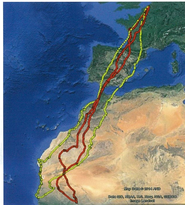
Trekroutes van 2 gezenderde vogels

In 2013 werden drie volwassen vogels van een zendertje voorzien, twee mannetjes en een wijfje. Tijdens het broedseizoen verzamelden we heel wat gegevens over hun verplaatsingen. In het voorjaar van 2014 kwamen de twee mannetjes terug zodat we niet enkel hun trekroute konden achterhalen maar ook opnieuw een heel broedseizoen hun leefgebied nauwkeurig in kaart konden brengen.